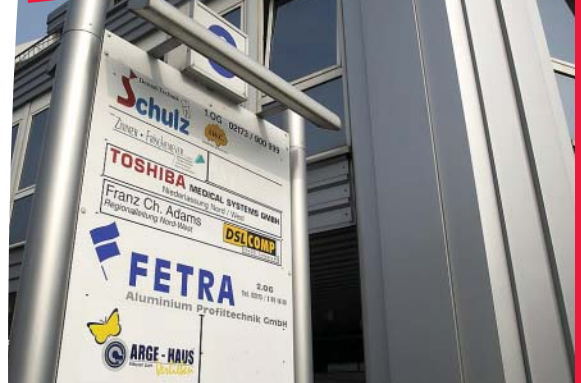
Mieter aus aller Welt schätzen Langenfeld

12.000 Quadratmeter in bester Lage Langenfelds Im Fachmarktzentrum Rheindorfer-/Hausinger Straße vermarktet Becker&Bernhard ein Top-Grundstück. Die insgesamt 12.000 Quadratmeter liegen direkt bei einem SB-Warenhaus und einem Diskont-Markt. Info: 02173/91 94-6