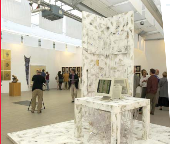
KunstWERK in der alten Weberei