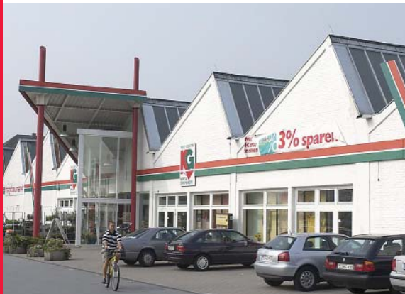
Kundenmagnet: Der Hagebaumarkt