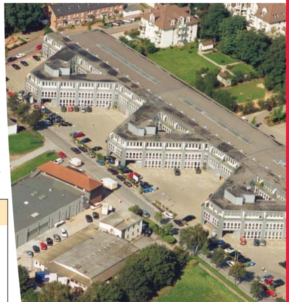
Eine gute Adresse: Gewerbepark Hausinger Straße